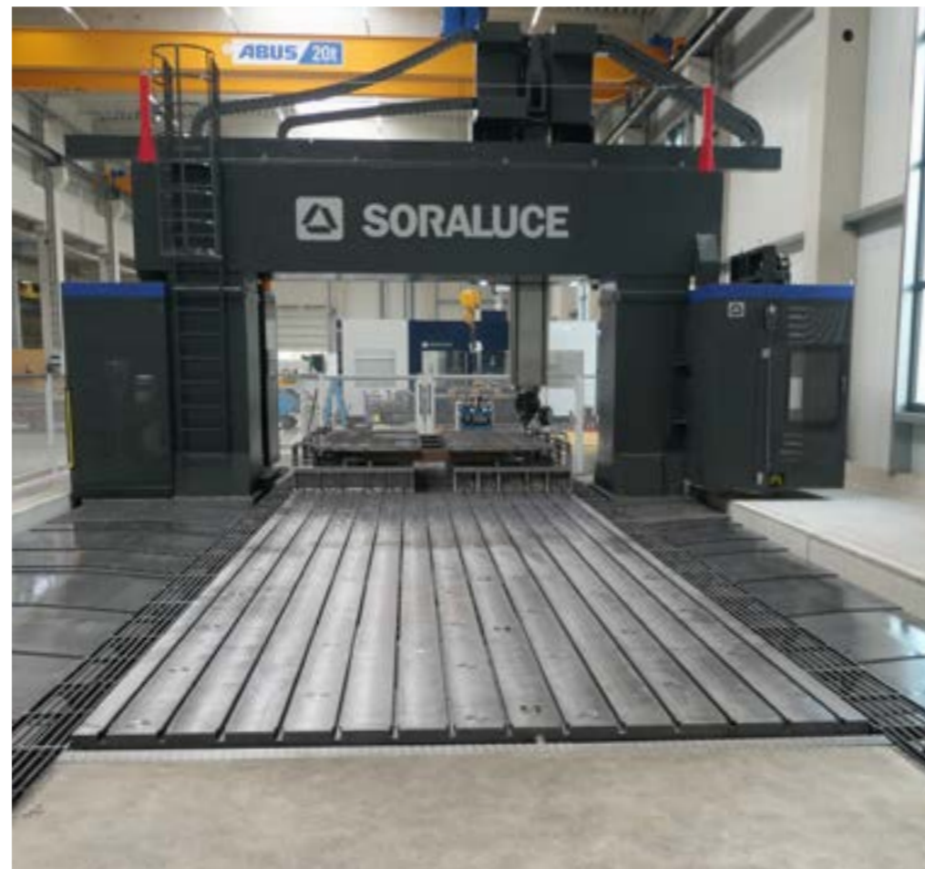
Die PMG 14000 verfügt über einen rund 132 m 3 großen Bearbeitungsraum.

Die Software zu VSET erstellt schließlich einen Spannplan des Werkstücks. Dieser enthält detaillierte Angaben in Bezug auf einen Referenzpunkt, den die Maschine vor der Bearbeitung mithilfe eines Messtasters aufnimmt. Dadurch lassen sich Ausrichtungsverfahren standardisieren und beschleunigen. Somit werden die Zeiten für die Best-Fit-Berechnung sowie die Vermessungs- und Ausrichtevorgänge mit VSET um bis zu 70 % reduziert. Nicht umsonst wurde diese bahnbrechende Erfindung daher mit dem Best of Industry Award ausgezeichnet.