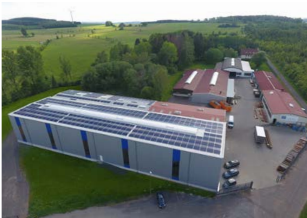
Die neue Produktionshalle (vorne) eröffnet neue Produktionskapazitäten.